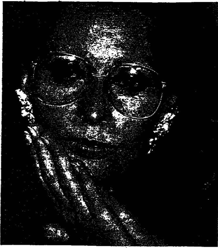
لقد فشل فيلم (كونتيسة من مونرو كونغ) لكن ما تعلمته من شايان جعل تلك التجربة بالنسبة الي نضرا . الان ذهب لشارلي ، وان يكون هناك رجل مثله . فني لحظات ضغني استعيد كملته الحكيمه ، كما يخرج البخل قطع الذهب من صرته ويعددها!

كانت مارلين . منذ مدة طويلة كانت تشعر انها وحيدة ، واعتقد ان الوحدة هي التي قادتها الى الانتحار . او ربما انتحرت لانها انتظرت حبيبا لم يات . اناس كثيرون اعتقدوا ان الحروف من الشيفوخة تادها الى مثل نفسها . انا لا اعتقد ذلك . لقد سقطها الشعور بانها بلا اسفاه . بانها معزولة . كانت مارلين ذات موهبة كبيرة كممثلة . بالإضافة الى قدرتها على اللغز . ليس هناك من يستطيع ان يعلم ممثلة كيف تغري ، وتصنع رمزا جنسيا . اكبر مثال